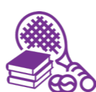
康樂、體育或文化用途的樓宇及場地