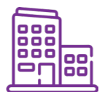
辦公大樓及辦公室