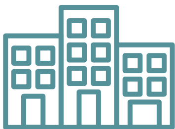
處所的處置及／或管理