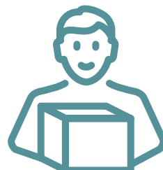
貨品、服務及／或設施的提供