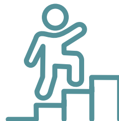
公共團體的投票及參選晉身 該等團體的資格等

《種族歧視條例》對學校具有約束力，學校、教師和學生可透過本教材套簡單瞭解《種族歧視條例》賦予他們的權利和責任。