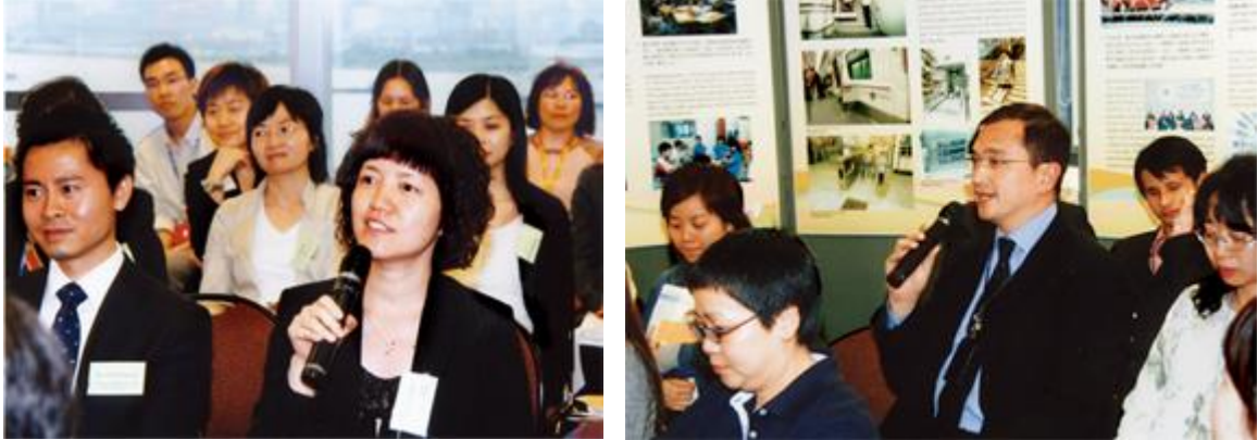
參加者在問答環節中提出了處理個案時遇到的實際問題。

平等機會之友會自 2006 年 10 月成立以來，經常收到會員就病假事宜提出的查詢。因此，平機會於 2007 年 4 月 25 日舉辦了專為平等機會之友會而設的病假及殘疾事宜研討會，有超過一百位來自非政府組織和公私營機構的僱主和人力資源從業員參加。