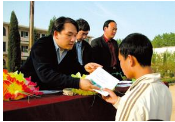
智行基金會為華中地區受愛滋病影響的兒童提供援助。