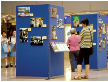
「你眼看平等」巡迴攝影展覽

平等機會委員會(委員會)一年一度的主要公眾教育活動—「平等機會博覽 2005」於本年10月29日在樂富中心揭幕。今年博覽的主題為「無懼障礙 創造未來」，活動將於2005年11月及12月進行。