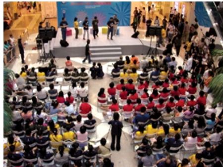
「平等機會博覽 2005」每年均吸引不少人士參加