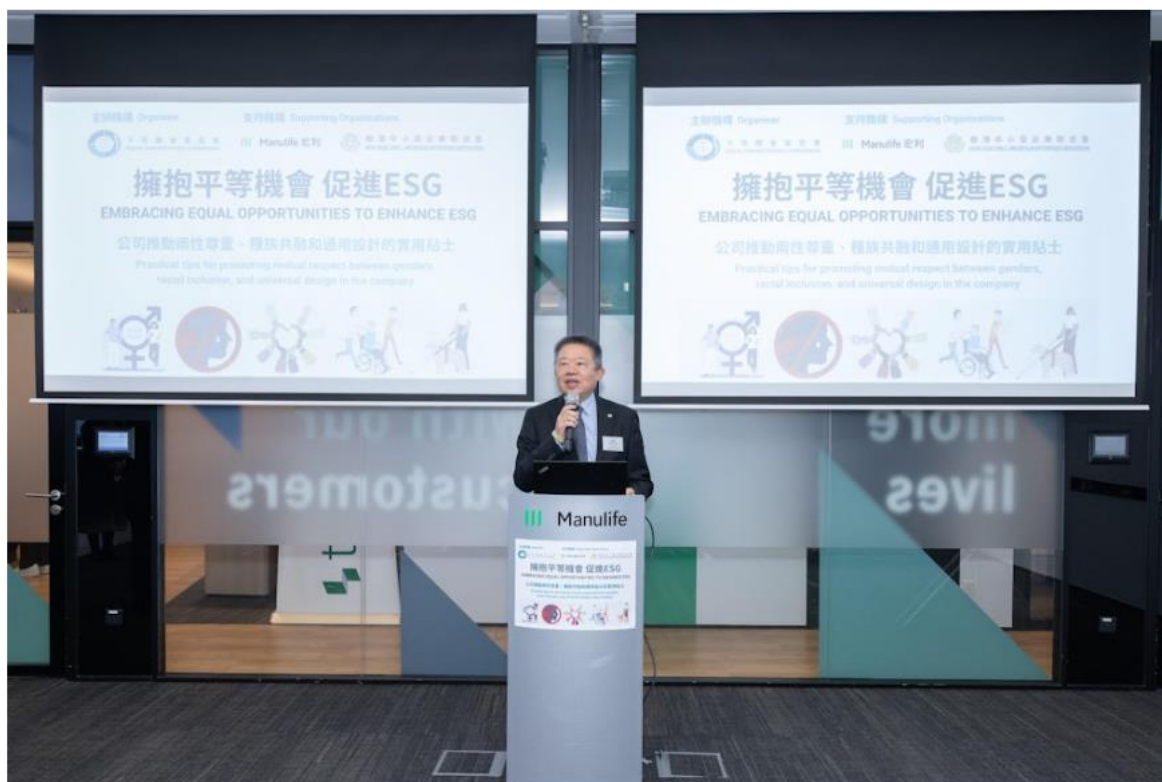
平機會主席朱敏健在「擁抱平等機會 促進ESG」研討會中致辭，鼓勵中小企實施平等及多元共融的措施，提升社會責任及企業管治。

預防職場性騷擾是社會及管治的重要元素。僱主有責任為僱員提供一個安全、沒有性騷擾的工作環境，並應實施性騷擾零容忍政策及制定預防反性騷擾措施，例如設立申訴機制、委派指定人士處理投訴和安排培訓課程等，從而做好風險管理，減低有關事件對企業的影響。