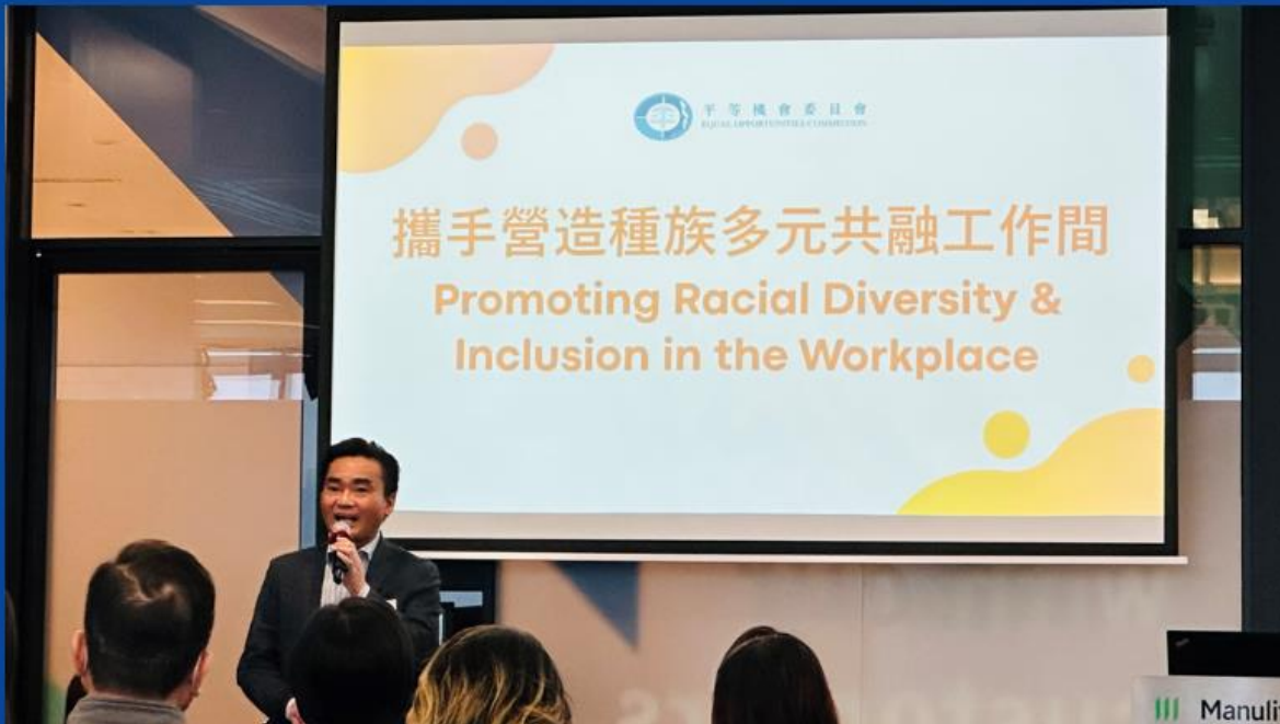
【HKIRC出席平機會主辦「擁抱平等機會 促進ESG」座談會】