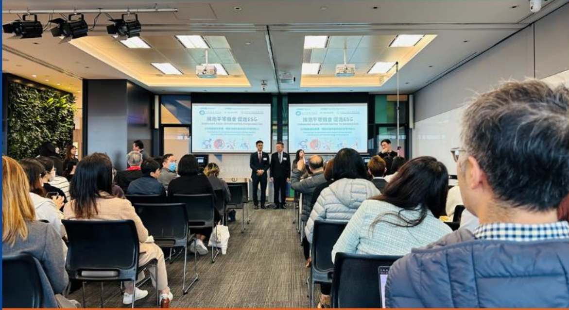
【HKIRC出席平機會主辦「擁抱平等機會 促進ESG」座談會】