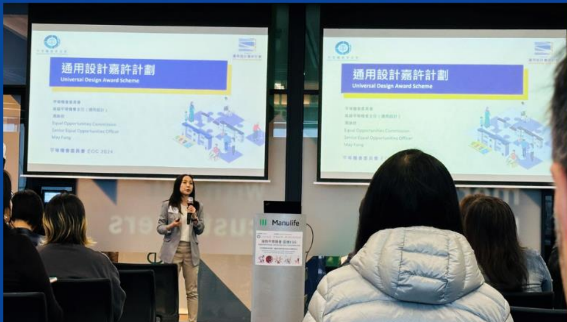
【HKIRC出席平機會主辦「擁抱平等機會 促進ESG」座談會】