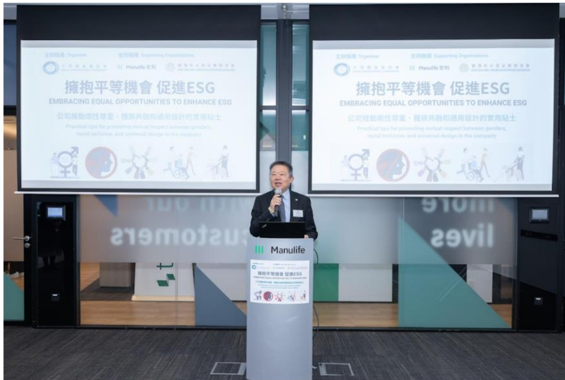
平機會主席朱敏健在「擁抱平等機會 促進ESG」研討會中致辭，鼓勵中小企實施平等及多元共融的措施，提升社會責任及企業管治。

另外，建立多元共融的職場文化，是實踐ESG的重要策略。香港交易所在2022年更新了《企業管治守則》，不再接受董事會只有單一性別成員的上市申請人，而現有上市公司也須於2024年年底前遵守規定，委任最少一名另一性別的成員加入其董事會。除了性別，種族多元化亦不容忽視。為了鼓勵企業營造種族多元共融工作間，平機會在2018年推出《種族多元共融僱主約章》，讓僱主明白僱用多元人才對企業的好處，藉此推動不同種族群體的平等就業機會。研討會上，少數族裔事務組代表介紹《約章》內有關共融政策、文化及環境的九項指引，例如在招聘、晉升過程中對任何種族人士一視同仁、加強僱員對種族共融的意識、了解不同種族在溝通及政策上的需要。